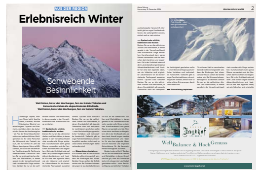
Beispiel Inserat 1/2 Seite