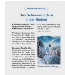
Beispiel „Erlebnistipp groß“